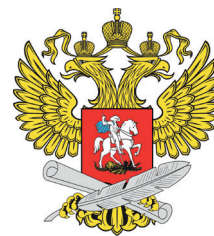
Министерство просвещения РФ